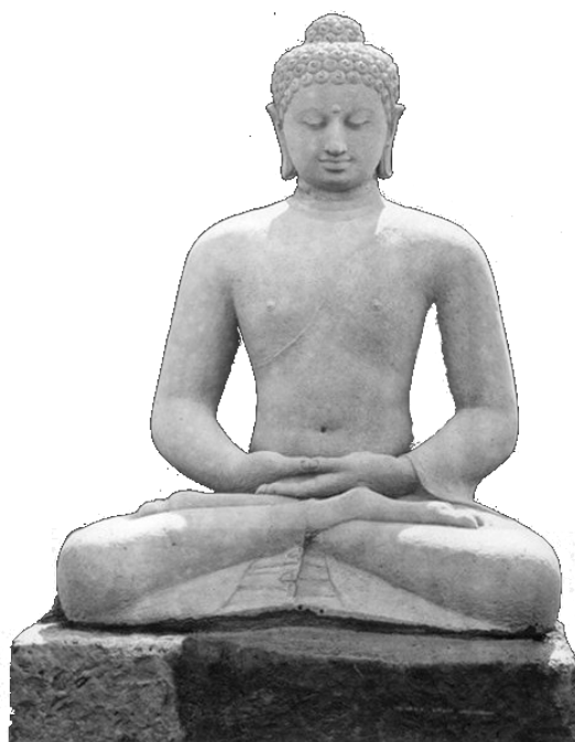
Статуя Будды Ами табхи (Боробудур, Индонезия)

Отв: Тот, кто чист и сострадателен в сердце и отважен разумом, не должен ничего бояться: ни человек, ни полубог, ни брахмараккхас, ни демон или дэва не могут причинить ему вред, но некоторые [из них] имеют власть мучить нечистых [сердцем], а также тех, кто пригласит их приблизиться [с помощью магии].