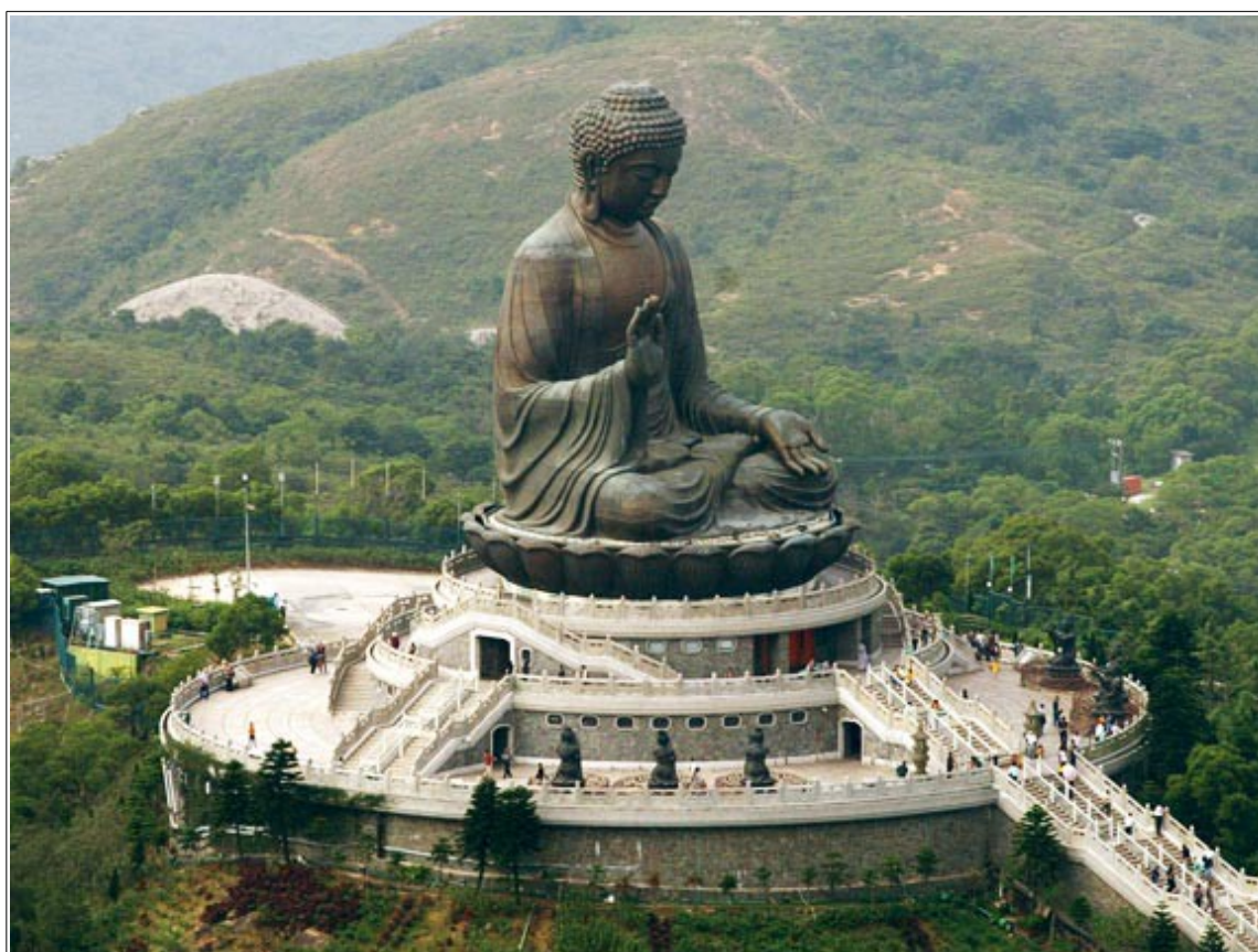
Статуя Будды в монастыре По Линь на острове Лантау, Гонконг, Китай, бронза, 26 метров высоты, 250 тонн