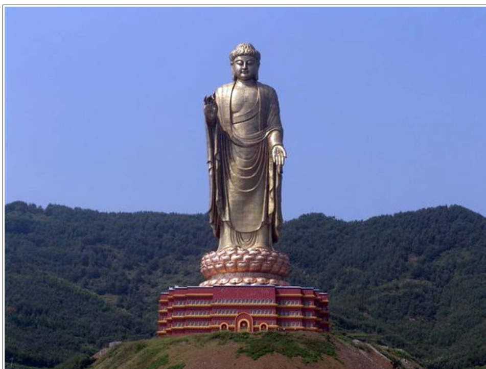
Статуя Будды Вайрочана, Хенан, Китай, 2002 год, высота 153 м

Отв: Они говорят нам, что Его обыкновением было каждое утро глядеть поверх мира и своим Божественным (ясновидящим) взглядом смотреть туда, где находились люди, готовые воспринять истину. Он тогда умудрялся, насколько возможно, достигнуть их. Когда люди посещали Его, Он вглядывался в их разум, читал их тайные побуждения, а затем проповедовал им в соответствии с их потребностями.